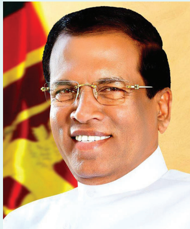
අනිග්‍රහ ජනාධිපතිතුමාගේ ජනවිඛ්‍ය

පශ්චාත් යුධ ශ්‍රී ලංකාවේ සංවර්ධනය හා යුක්තිය ප්‍රශාසනා ගැනීම සඳහා වූ කතිකාවත තුළ මානව හිමිකම් ප්‍රවර්ධනය හා අපරානුමත කර ඇති මානව හිමිකම් සම්මුතීන් මෙන්ම ස්වේච්ඡා ප්‍රතිඥාවන් ක්‍රියාත්මක කිරීමේ වැදගත්කම ශ්‍රී ලංකා රජය විසින් හඳුනාගෙන ඇත.